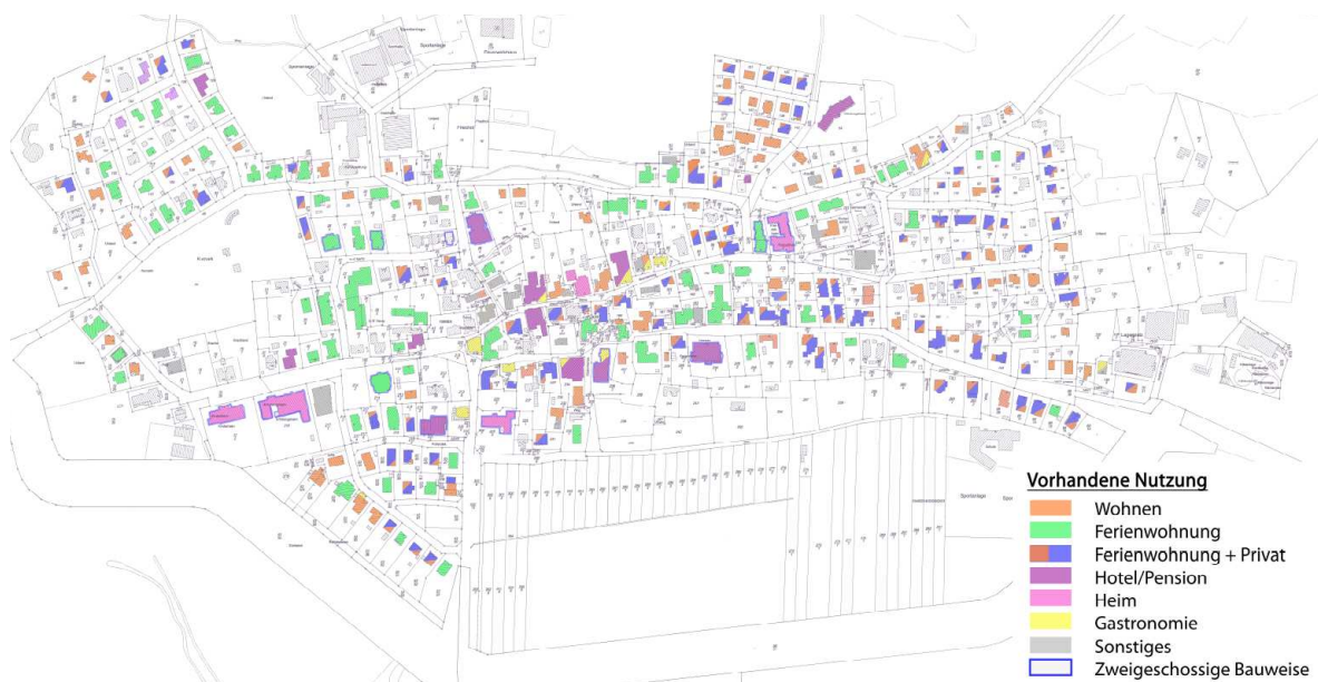
Abbildung 1: Real erkennbare Nutzungen

Bei dem Plangebiet handelt es sich um einen nahezu vollständig erschlossenen und bebauten Bereich, der sich in Art und Maß der baulichen Nutzung wie folgt darstellt: