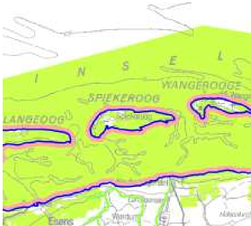
Abbildung 3: Auszug aus dem LROP

Das LROP Niedersachsen aus dem Jahre 2017 enthält keine der Planung entgegenstehenden Darstellungen. Der Ortskern ist nicht erfasst.