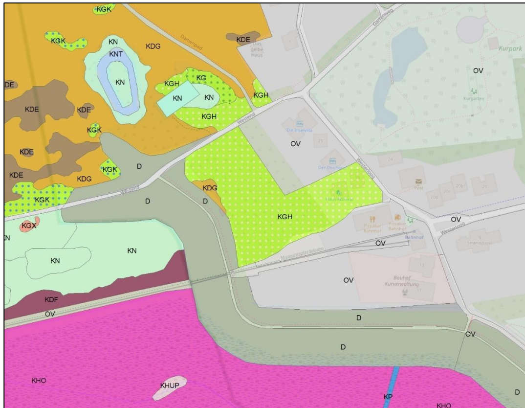
Abb.: Biotoptypen im Bereich des Bahnhofgeländes von Spiekeroog 9

tet. Die bisher letzte vorliegende Kartierung, die allgemein verfügbar ist, stellt die Biotoptypen im Bereich des Plangebiets wie folgt dar: